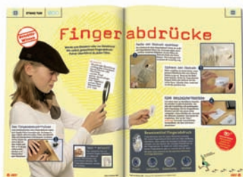
ETWAS TUN. Basteltipps, Rezepte und Experimente regen zum Mitmachen an.