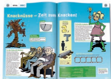
KNACKNUSS. Knifflige Rätsel für jedes Alter fördern das logische Denken.